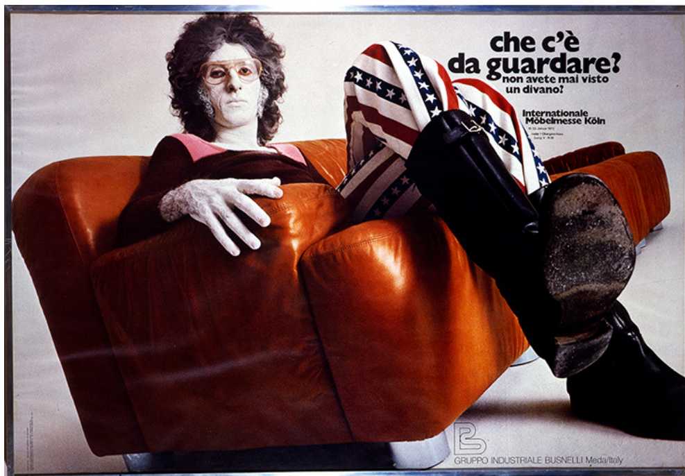
Figure 1. Work of Gianni Sassi

è certamente Gianni Sassi (1938-1993). Con le sue numerose imprese all'intersezione fra settori diversi, in particolare a Milano fra gli anni sessanta e ottanta, Sassi ha anticipato, interpretato e sintetizzato modi di operare che sono ancora oggi di grande attualità per la cultura del design. Art director, pubblicitario, produttore discografico, editore, autore, promotore e organizzatore culturale, Sassi si è mosso con curiosità, passione e intelligenza in diversi ambiti – dall'arte all'industria, dal teatro alla musica, dalla poesia all'arte culinaria. Nel suo percorso ha costantemente collaborato con varie figure di artisti, autori e intellettuali, musicisti – come Umberto Eco, Omar Calabrese, Nanni Balestrini, Gianni-Emilio Simonetti, Daniela Palazzoli, Demetrio Stratos.