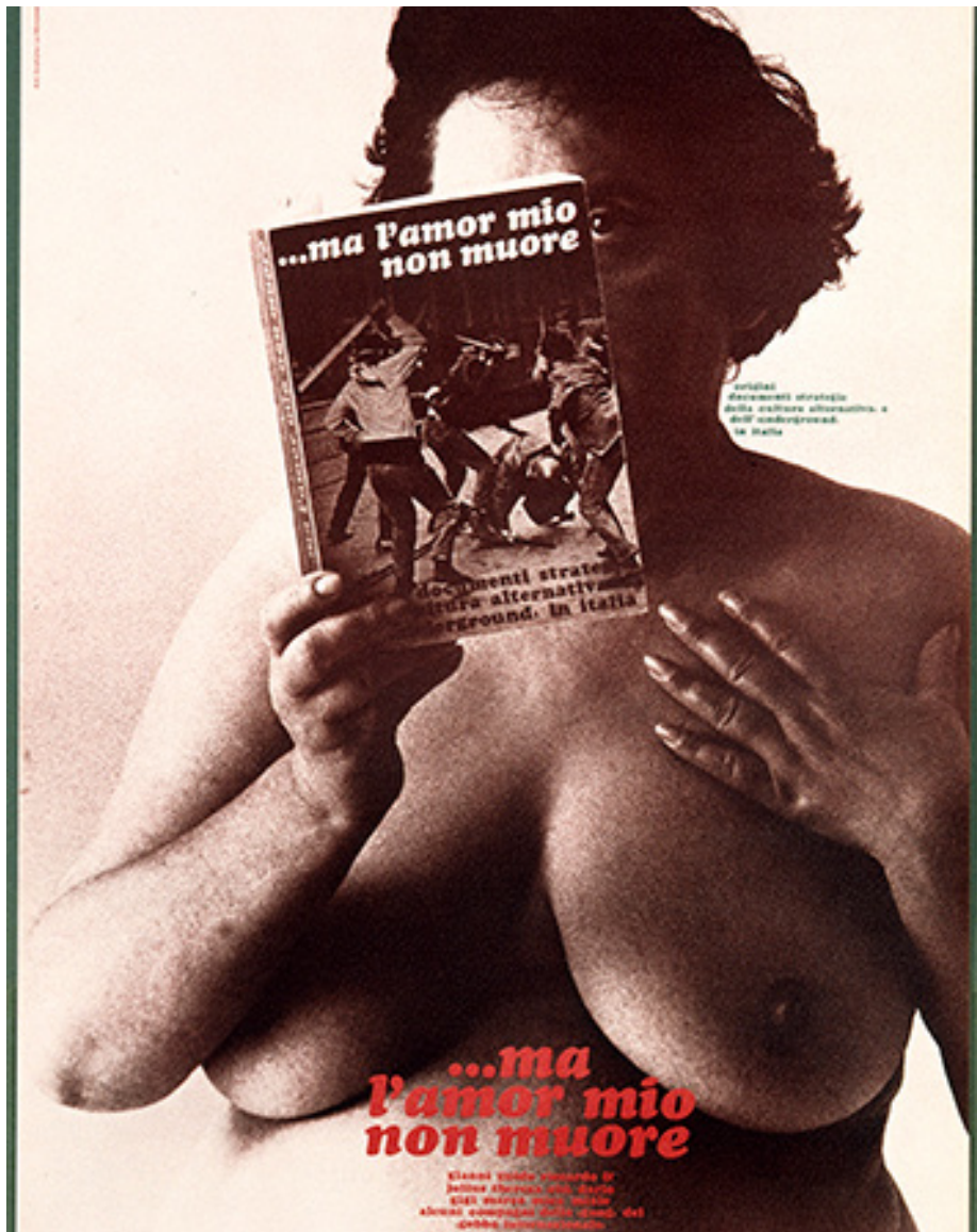
Figure 7. Work of Gianni Sassi