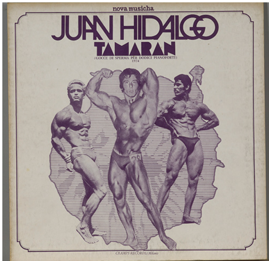
Figures 3, 4. Work of Gianni Sassi