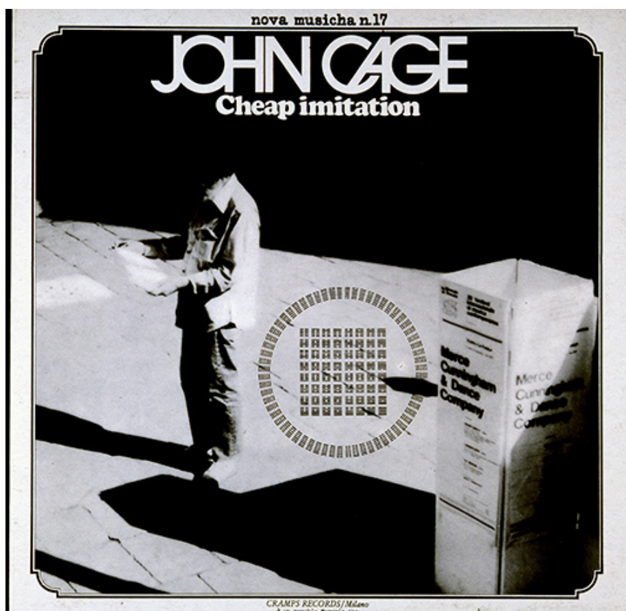
Figure 2. Work of Gianni Sassi

La ricerca condurrà alla pubblicazione di un libro che ricostruisce diverse vicende dell'attività di Sassi.